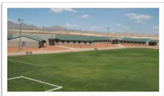
Centro Juvenil de Summit View