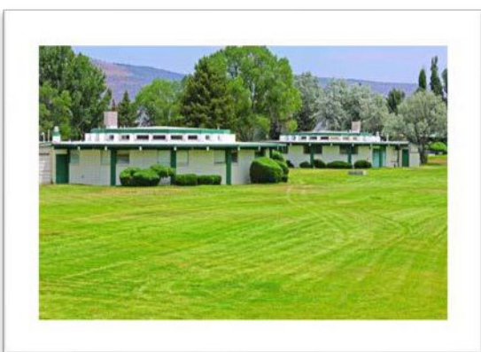
Centro de Formación Juvenil de Nevada