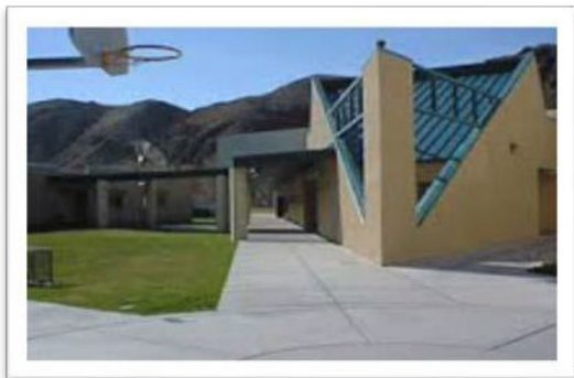
Centro Juvenil de Caliente